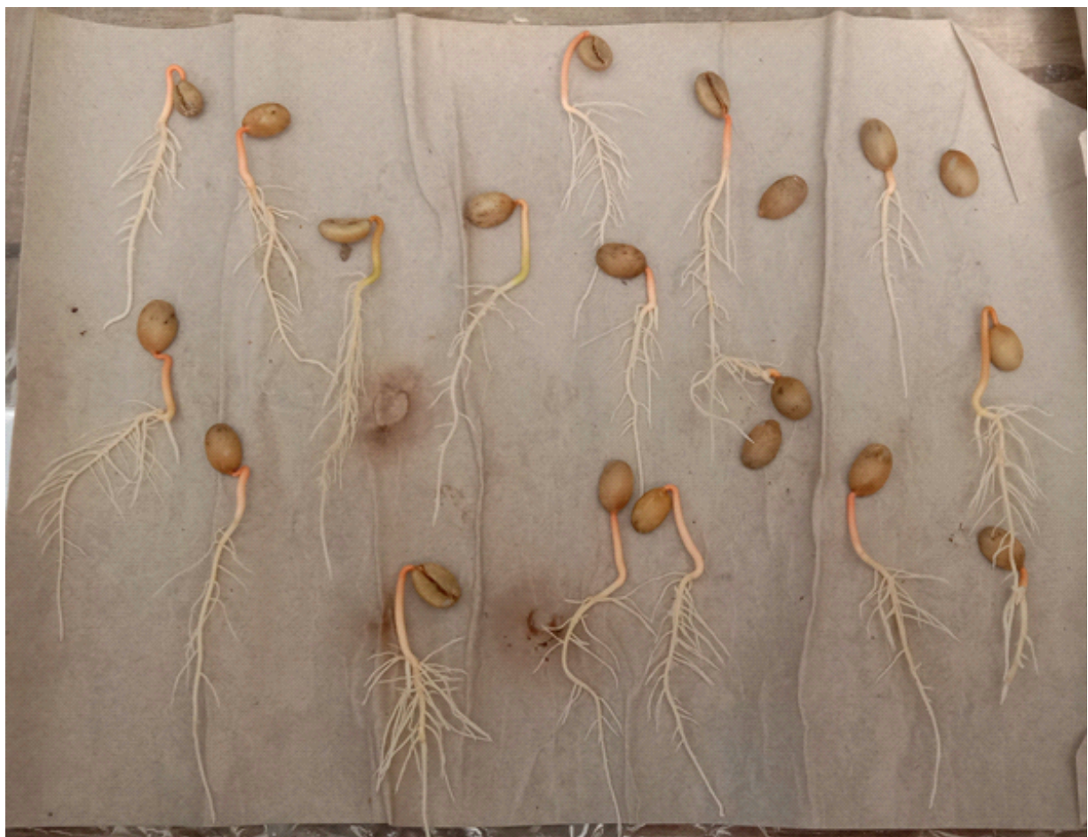
Gambar 2. Kondisi perkecambahan benih kopi setelah berusia 21 HSS