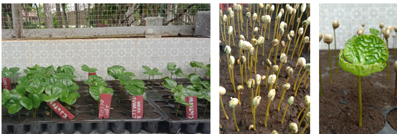
Gambar 4. Hasil pengujian daya berkecambah benih kopi menggunakan metode UKDDP setelah dipindah ke media tanah dan pasir

Keterangan: (U1) ulangan 1, (U2) ulangan 2, (U3) ulangan 3, dan (U4) ulangan 4; USDA, P88, dan Gayo 1 merupakan varietas kopi Arabika; Propelegitim dan Hibiro 1 merupakan varietas kopi Robusta.