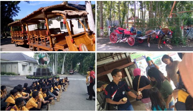
Fasilitas wisata dan kegiatan eduwisata yang berlangsung di CCSTP