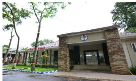
Contoh produk dan outlet pemasaran produk kopi dan kakao