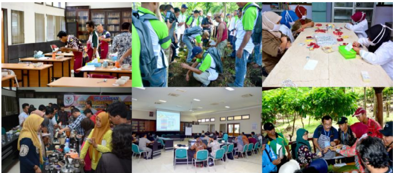
Kegiatan pelatihan yang dilakukan di CCSTP

Kegiatan magang ( internship ) dan pelatihan kerja merupakan salah satu produk diseminasi CCSTP yang bertujuan untuk memberikan pengetahuan praktek kepada konsumen secara hands-on sehingga konsumen dapat memiliki kompetensi pada bidang tersebut. Kegiatan