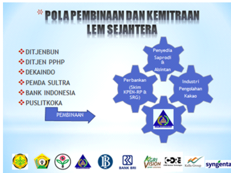
Pola pembinaan dan kemitraan LEM Sejahtera