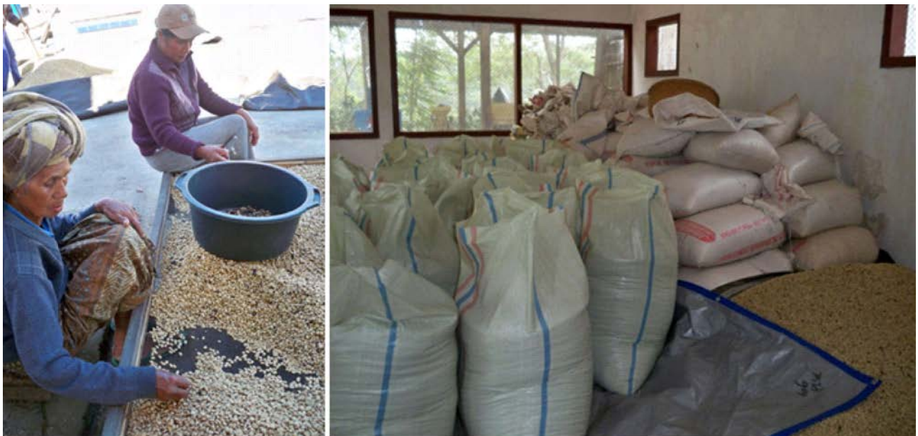
Kegiatan sortasi kopi dalam MOTRAMED di Kintamani, Bali (kiri) dan biji kopi siap kirim hasil pengolahan bersama di Kayumas, Situbondo (kanan)

Kelompok tani yang melakukan pemasaran kopi langsung kepada eksportir dan pengecer memiliki rantai nilai yang lebih sederhana dibandingkan dengan petani yang memasarkan kopi secara tradisional. Terkait dengan berakhirnya ICAs tersebut, maka rantai nilai kopi Indonesia terutama kopi spesialti mengalami perubahan yang sangat nyata dan berdampak pada peningkatan pendapatan petani.