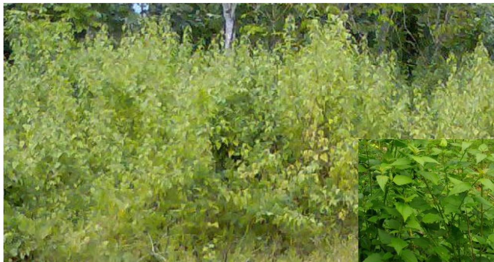
Populasi gulma siam ( C. odorata ) di sekitar perkebunan kakao

Perbandingan komposisi kimia bahan organik C. odorata dan pupuk kandang sapi dapat dilihat pada tabel dibawah ini.