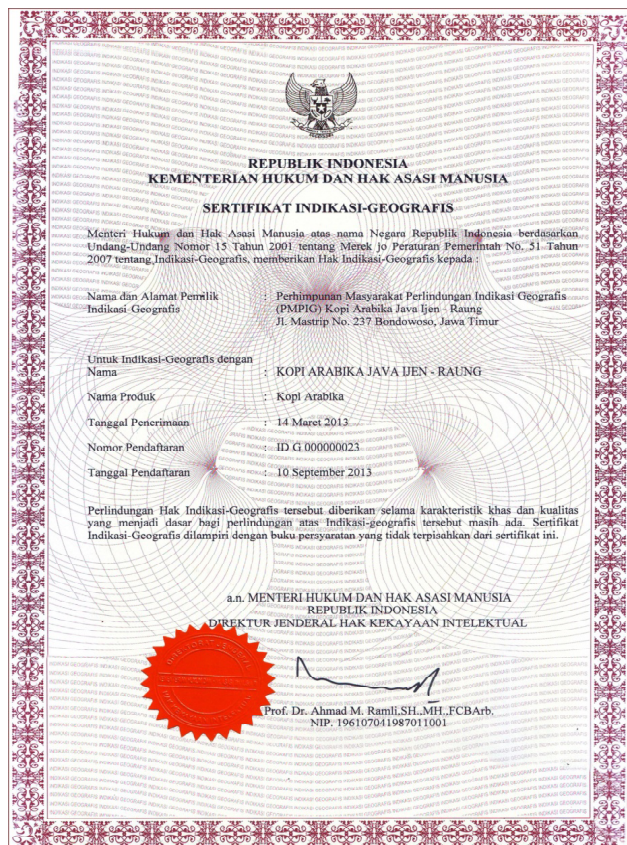
Sertifikat IG produk kopi Arabika Java Ijen Raung