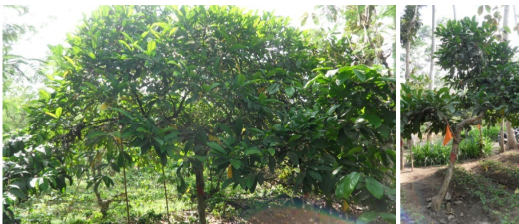
Keragaan tanaman kopi Liberika yang tumbuh besar

Penanaman kopi Liberika tersebut menggunakan bahan tanam asal benih sehingga kondisi tanamannya masih beragam menyebabkan kualitas citarasanya belum stabil. Untuk itu guna mendukung pengembangan kopi Liberika diperlukan ketersediaan bahan tanam unggul yang dikembangkan secara klonal agar diperoleh pertanaman yang secara genetik seragam.