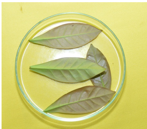
Eksplan daun kopi Liberika

Induksi eksplan adalah proses pertama yang dilakukan untuk memulai perbanyak somatik embriogenesis. Eksplan yang digunakan untuk perbanyak somatik embriogenesis kopi, baik kopi Arabika, kopi Robusta, maupun kopi Liberika adalah daun. Daun diambil dari pohon induk terpilih yang memiliki sifat-sifat unggul dan tahan hama penyakit. Untuk mengurangi tingkat kontaminasi, daun dari pohon induk terlebih dahulu diperlakukan dengan fungisida. Daun yang diambil sebagai bahan induksi adalah daun muda ( flush ) yang sudah membuka sempurna. Daun yang masih terlalu muda tidak bisa digunakan sebagai eksplan sebab jaringannya belum terbentuk sempurna sedangkan daun tua memiliki jaringan yang tidak meristematis sehingga sifat totipotensinya berkurang.