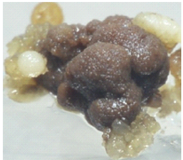
Berbagai jenis kalus kopi Liberika