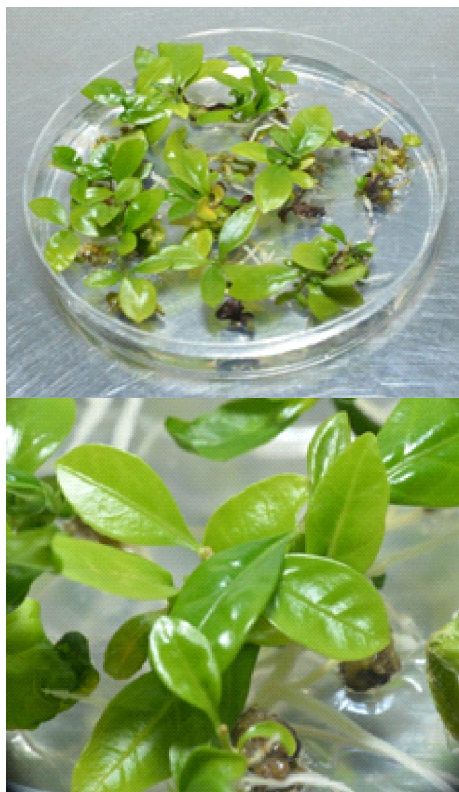
Perkecambahan embrio somatik

Pada proses selanjutnya, kecambah akan tumbuh menjadi planlet atau sering disebut sebagai "tanaman kecil". Pada tahapan ini kebutuhan unsur hara dan pengaruh lingkungan menjadi sangat penting, karena setiap jenis kopi Liberika mempunyai kebutuhan nutrisi dan lingkungan yang berbeda-beda. Selain itu kecambah kopi Liberika juga membutuhkan cahaya yang cukup besar untuk proses fotosintesisnya. Hal tersebut disebabkan karena planlet sudah membentuk daun dan akar meskipun belum sempurna.