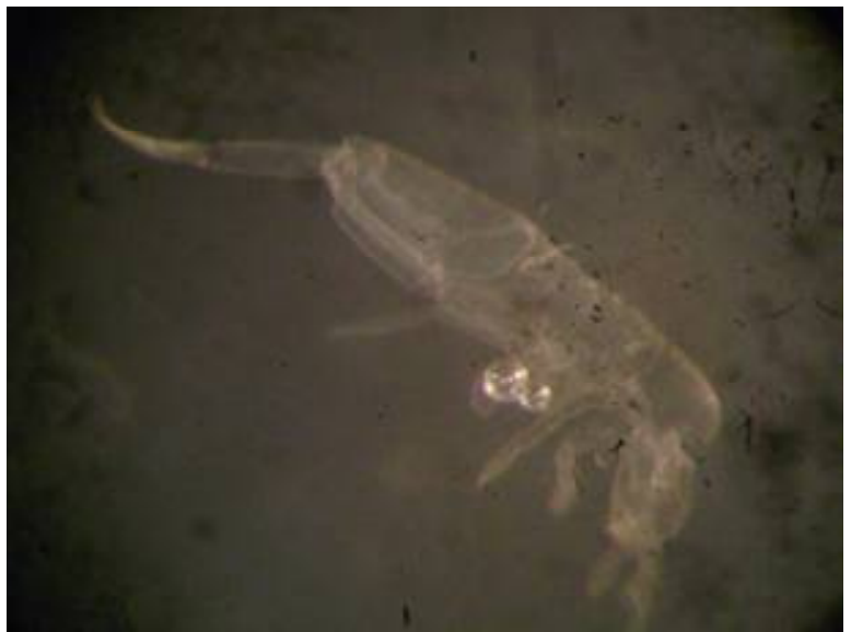
Contoh Collembola yang ditemukan di kebun kakao KP. Kaliwining (Rahayu, 2018)