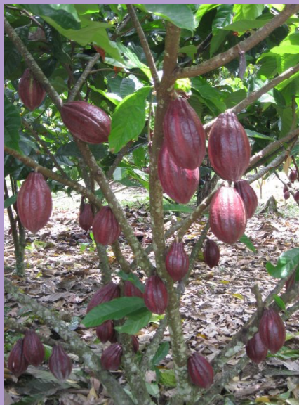
45 (MCC 02)

Produksi tinggi, toleran kondisi marginal.