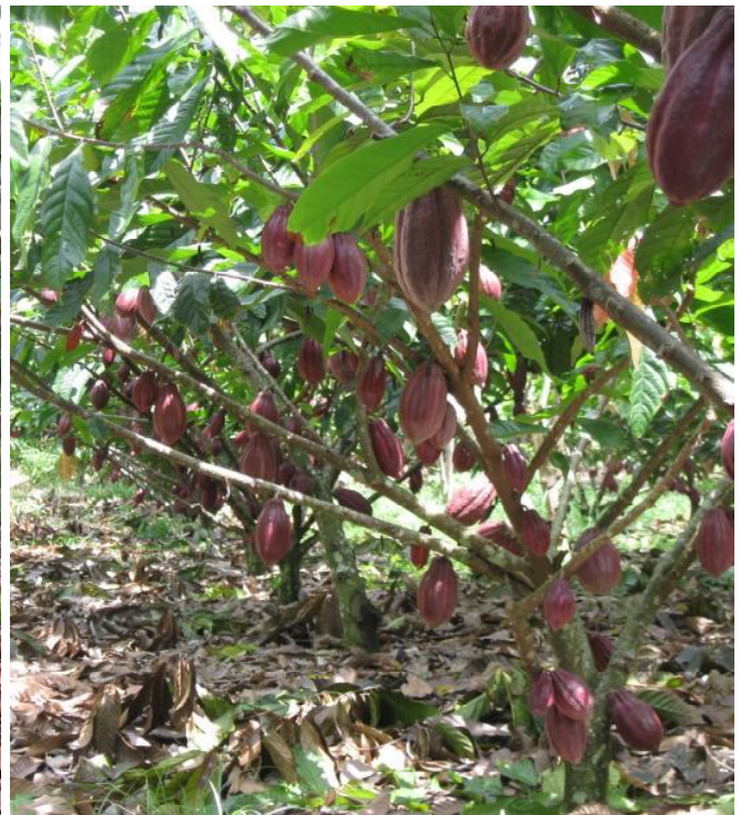
Klon MCC 01 dan MCC 02 menunjukkan potensi pembuahan yang tinggi di lapangan