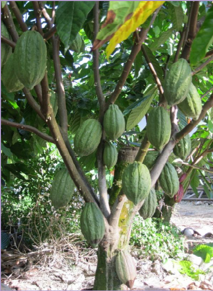
MO1 (MCC 01)

Dayahasil tinggi (>3 ton/ha/thn), biji besar.